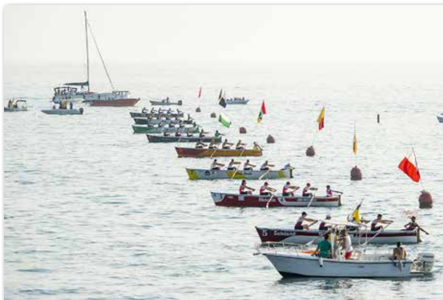
Pochi attimi prima della partenza del Palio, la gara regina della tradizione livornese

Presentati il nuovo testo delle Carte Remiere e i due nuovi organismi CGR e Agorà del Remo