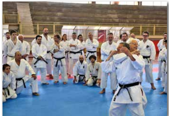
Alcuni momenti del seminario di San Vincenzo