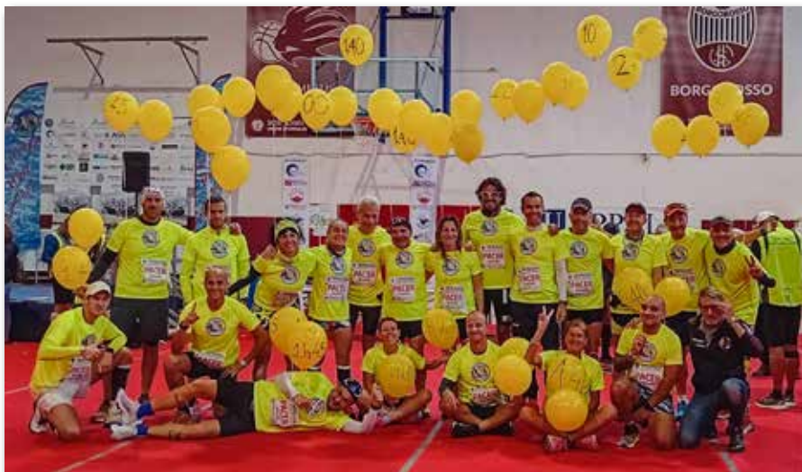
Il gruppo dei Pescer

podio nella scorsa edizione, impiegando 1.24.11.