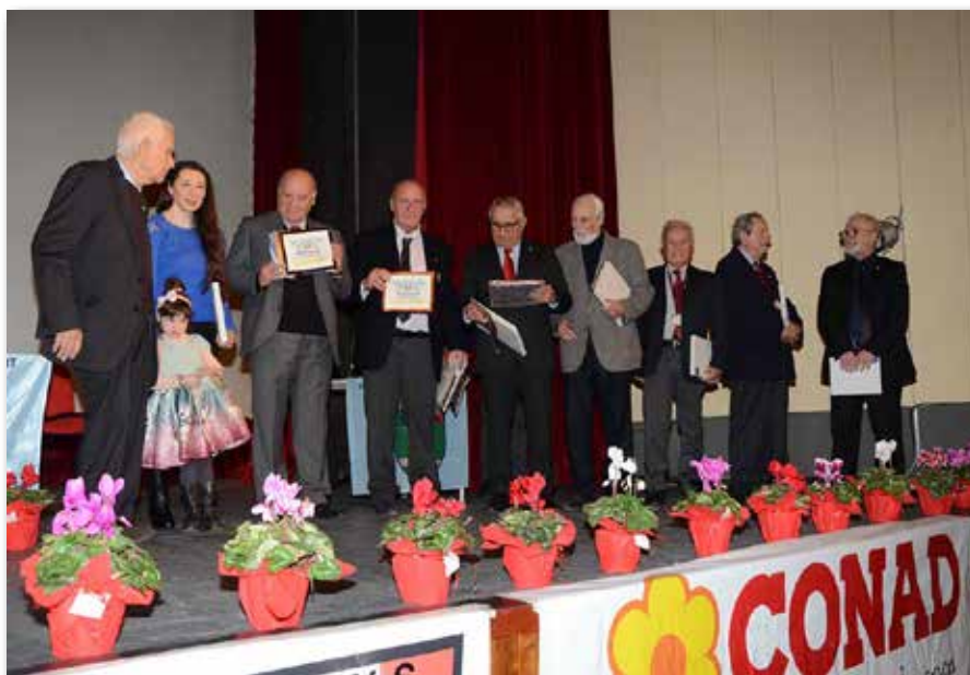
Foto di gruppo dei Veterani dello Sport di Livorno