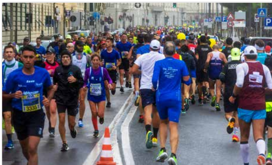
"Il gruppone" di partecipanti in un tratto di gara sul Viale Italia

Quasi duemila partecipanti in una manifestazione riuscita alla perfezione