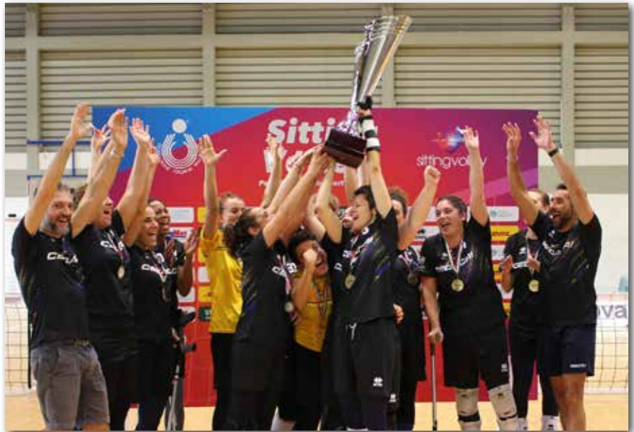
La Cedacri GiocoParmaVCCesena solleva la Supercoppa Italiana 2023

Le emiliano-romagnole superano le detentrici del titolo del Dream Volley Pisa al termine di una gara spettacolare ed equilibratissima risoltasi solo ai vantaggi del tiebreak per 3-2