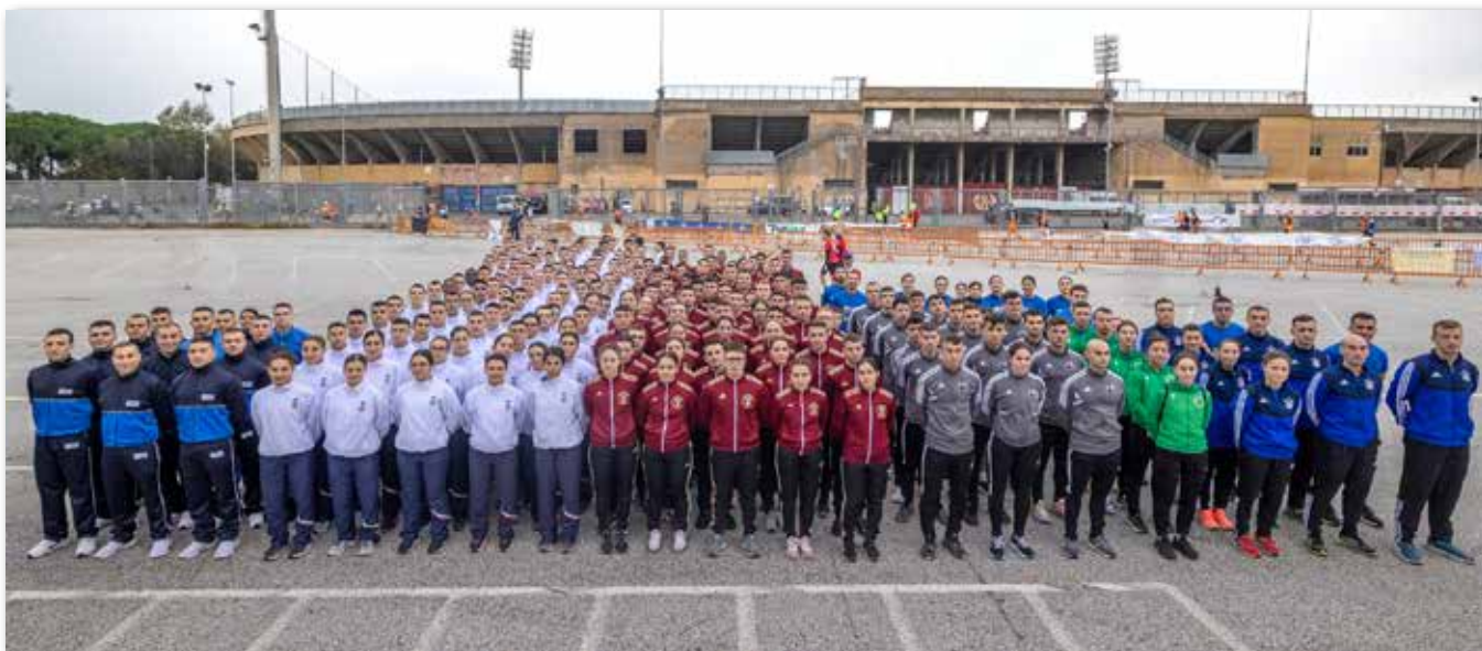
Gli allievi dell'Accademia Navale che hanno partecipato alla Stralivorno