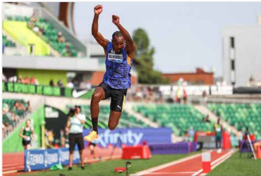
Il campione Andy Diaz in azione