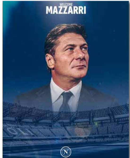
Il post con cui il Napoli ha annunciato il ritorno di Mazzarri

Il numero uno azzurro ha scelto di puntare su Walter Mazzarri. Il tecnico di San Vincenzo torna sulla panchina dove si è seduto dal 2009 al 2013 conquistando anche una Coppa Italia nel 2012. Mazzarri ha accettato un contratto fino a giugno, motivo decisivo per la scelta da parte di De Laurentis che in estate vorrà puntare su un nuovo ciclo con un tecnico probabilmente giovane (Italiano o Farioli?). Ecco quindi la