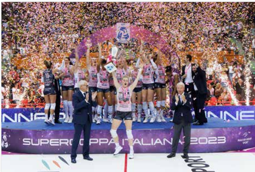
L'esultanza della Imoco alla conquista dell'ennesimo trofeo

In un palazzetto gremito Conegliano batte Milano per 3-1 alla fine di una gara spettacolare