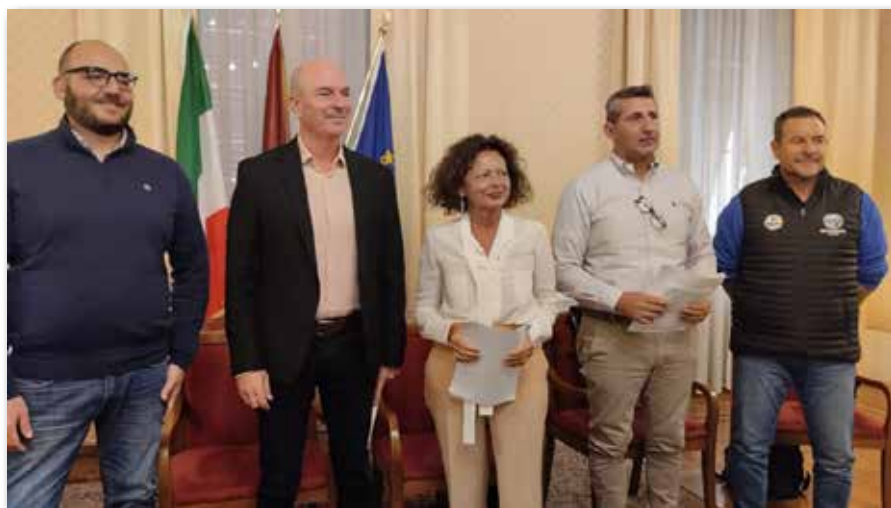
Una foto della conferenza stampa di presentazione del nuovo Consiglio e dell'Agorà a Palazzo Comunale

Il Sindaco ha voluto puntualizzare l'importanza dell'inserimento dell'obbligo di avere a bordo dei gozzi a 10 remi due atleti con età uguale o inferiore a 21 anni compiuti o da compiere nell'anno delle gare