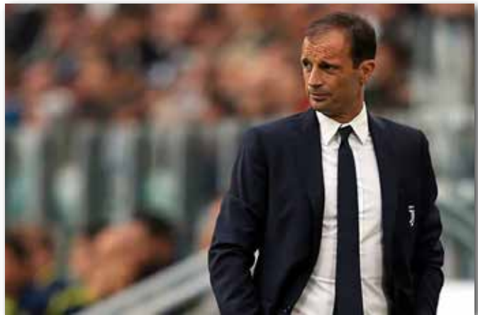
Massimiliano Allegri in un match allo Juventus Stadium