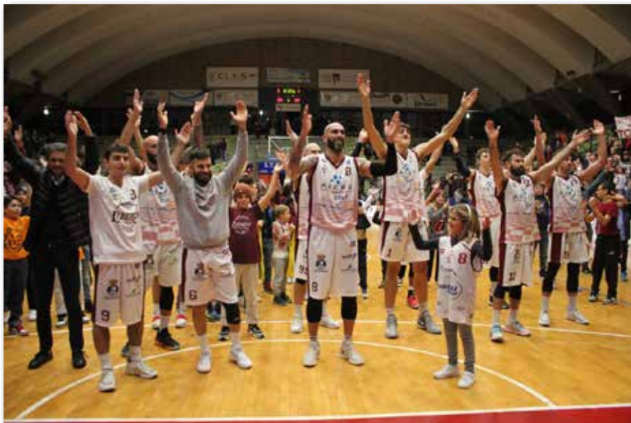
Tutta la squadra festeggia un successo al PalaMacchia sotto la Curva Nord

Gli amaranto con una striscia di otto vittorie consecutive si sono presi la vetta