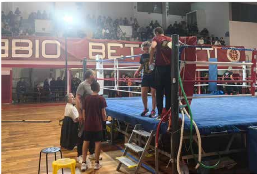
Il PalaCosmelli gremito poco prima dell'inizio degli incontri.