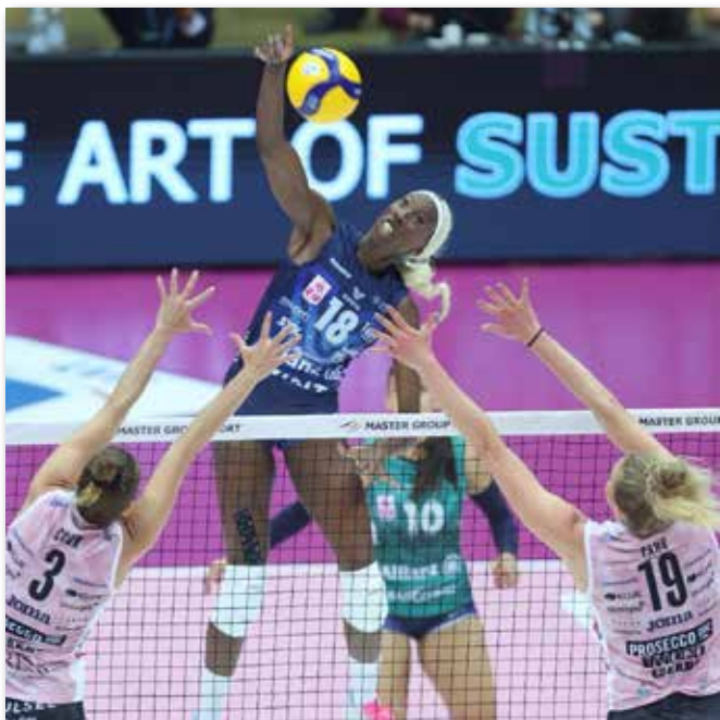
Paolo Egonu, top scorer per Milano, in una fase d'attacco