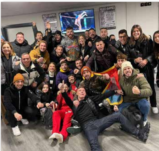
La foto di gruppo con i 40 amici arrivati in Inghilterra per sostenere il livornese

Il livornese è il quinto italiano a essere riuscito a stringersi una cintura di questa caratura intorno alla vita. Un grande passo in avanti per la sua carriera e per la storia delle MMA nazionali