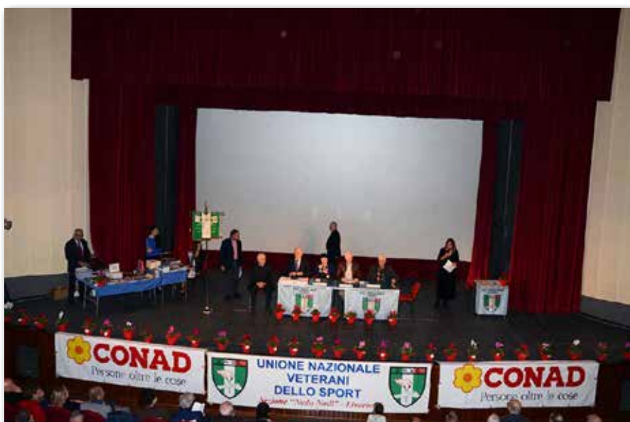
Un'immagine della sala del cinema 4 Mori, sede che ha ospitato la manifestazione